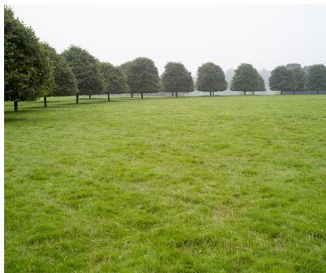
Ring aus Lindenbäumen im Woodstock Park beim Blenheim Palace.