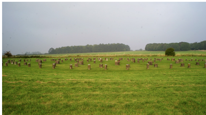
Ring aus Pfosten in Woodhenge, in der Nähe von Stonehenge.