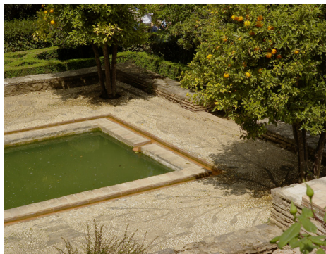
Patio der Apfelsinen in der Alhambra in Granada.