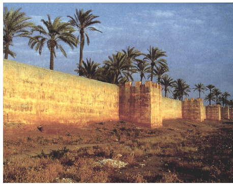
Grosse Gartenmauer in Taroudant, Marokko.