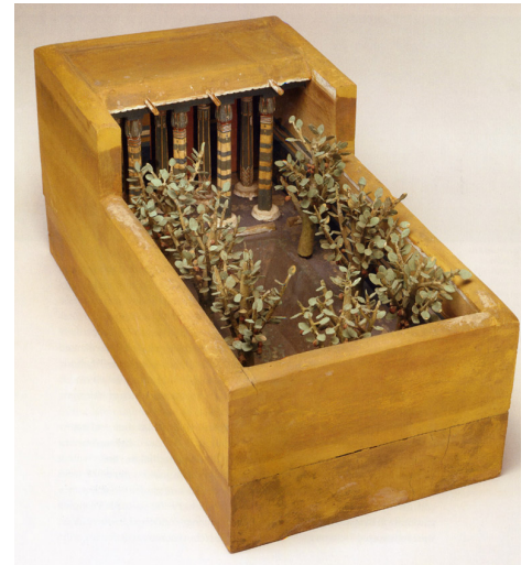
Modell eines ägyptischen Hauses mit Garten (Tomb of Meketre, 1990 B. C.). In: Bonnechere, de Bruyn (1998)

Mesopotamien ist ein weiteres Beispiel, wo frühe Vermessung und Geometrie betrieben wurde. Dort fand die Aufteilung des Kreises in 360° und Minuten ihren Ursprung. Griechische Trigonometrie leitete ihre Elemente von sumerischen Entdeckungen ab, die 3000 Jahre zuvor gemacht wurden. Die Beziehung von Raum, Zeit und schriftlicher Regelung bildete die Voraussetzung einer organisierten Landschaft und den Schlüssel zum Erfolg einer anerkannten hydraulischen Zivilisation. Der Anstieg von solchem Wohlergehen - mehrere erfolgreiche Ernten pro Jahr - erforderte aber zudem die Einrichtung und Organisation ihrer Verteidigung und führte in der Folge auch zu Kriegen. Die Auswahl der geeigneten Pflanzen, deren Anzucht und Pflege entwickelte sich zu einer vollendeten Kunst. Infolgedessen wurden die privaten Gärten befeindeter Herrscher zur bevorzugten Zielscheibe für Plünderung und Zerstörung: Der geschlagene König wurde enthauptet und dessen gepflanzte Bäume gefällt. Diese sehr assoziative Beziehung eines Herrschers zu seinem Garten hat sich bis heute erhalten. Die Beherrschung des Wassers sowie die sorgfältige Bewirtschaftung und Nivellierung