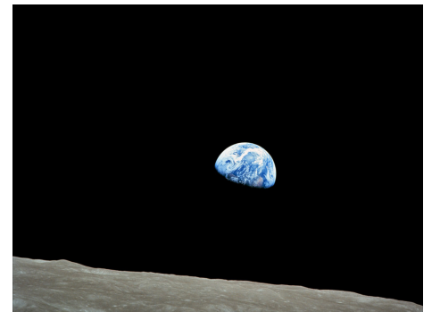
„Earthrise“, 24.12.1968, Fotografie aufgenommen von dem Astronauten William Anders während der NASA-Mission Apollo 8.