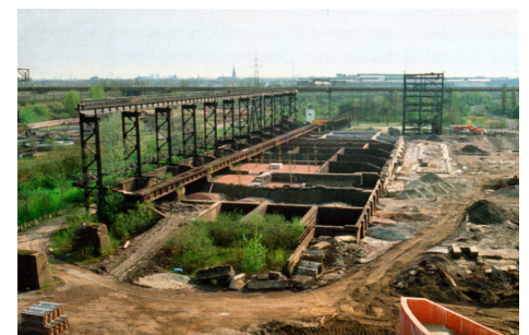
Landschaftspark Duisburg-Nord. Latz+Partner, 1998.