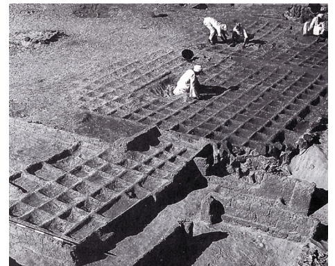
Blumenbeete eines ausgegrabenen ägyptischen Gartens. In: Carroll (2003)