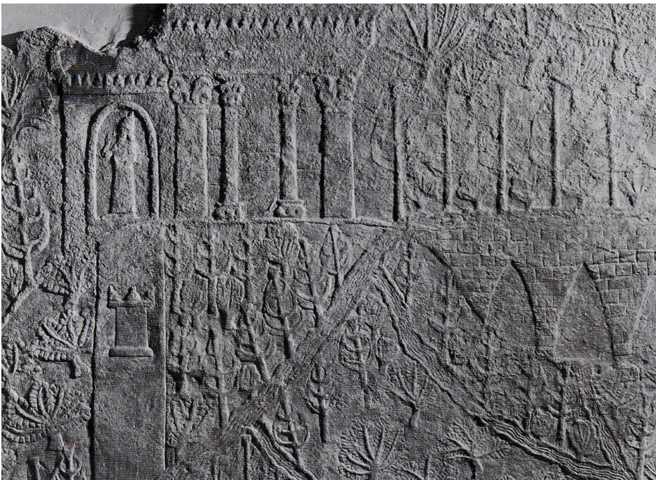
Assyrisches Relief , 650 v. Chr. In: Girot (2016)