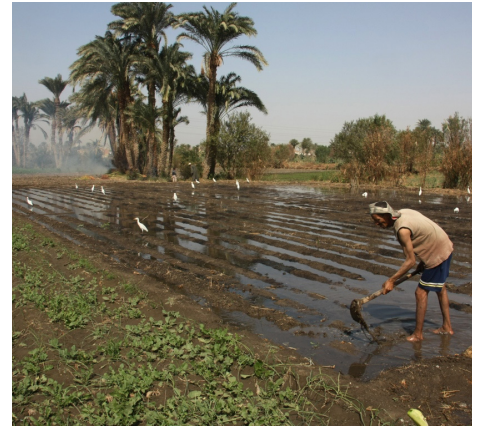
Bewässerte Felder in der Fayoum Oase, Ägypten In: Girot (2016)

grundlegenden Wandel der Landschaft: Dort, wo früher dürre Einöden vorherrschten, entstand eine ganz neue Ästhetik in Form ländlicher Auen, Haine und Feldern. Das Bewässern dieser Oasen veränderte die angestandenen sozialen Muster umfangreich und rief eine konzeptuelle Revolution hervor, die den vollständigen Bruch mit den urchinlichen nomadischen Stammesgewohnheiten auslöste. Die Landwirtschaft erforderte eine stark zentralisierte Regierungsform, um das Land funktional und produktiv zu erhalten. In der Geschichte begann dadurch die Bildung unterschiedlicher Fertigkeiten innerhalb einer Gesellschaft und begründete damit, bis zum heutigen Tage, den unwiderruflichen Ursprung von sozialer Ungleichheit und Tyrannei in dieser Region. Die ersten ummauerten Gärten und bewässerten Felder wurden dadurch zu den frühesten Symbolen für Besitz und Hierarchie. Der ummauerte Garten – ursprünglich vor allem für den Eigenbedarf kleiner halb-sesshafter Stämme konzipiert – entwickelte sich sukzessive zum verzauberten Landschaftspark einer erwählten Minderheit. Eben solche Exklusivität liess die Landschaft zum Machtsymbol eines Herrschers werden.