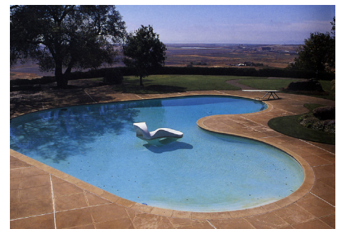
El Novillero in California, 1948. Thomas Church. In: Treib, 2003