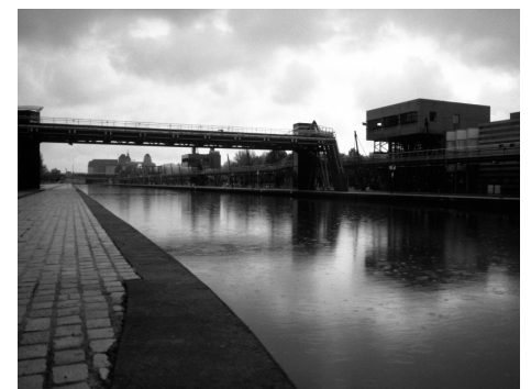
Parc de la Villette, Paris.