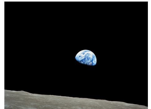
„Earthrise“, 24.12.1968, Fotografie aufgenommen von dem Astronauten William Anders während der NASA-Mission Apollo 8.