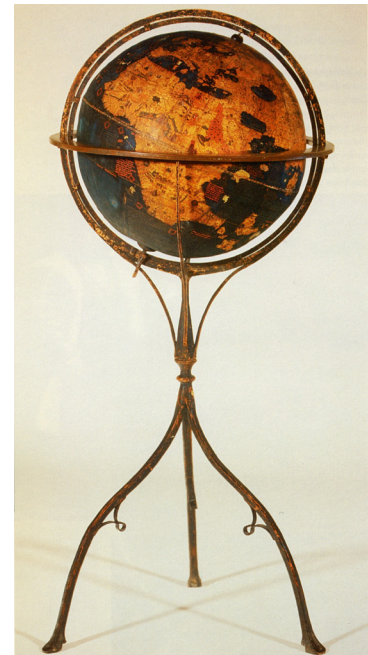
Globus von Martin Behaim, 1492. Germanisches Nationalmuseum, Nürnberg

Obwohl die Renaissancegärten im 16. Jh. hauptsächlich vom Klerus und vom Adel beauftragt wurden, spielten die humanistischen Philosophien und die Wissenschaften in der Entwicklung des Gartendesigns eine vorrangige Rolle. Infolgedessen gründete die Universität von Padua im Jahr 1545 einen botanischen Garten (hortus simplicius), um dort das Studium von Kräutern zu ermöglichen (darauf folgten Leiden um 1577, Paris um 1626, Oxford um 1632). Jedoch nicht nur das Interesse für die Philosophie und die Wissenschaft motivierte den Bau von Renaissancegärten, sondern auch die Lust, präzise Kunstwerke zu schaffen, die wiederum Macht und Wissen demonstrierten und Teil einer Wunderkammer waren. Ausserhalb der Stadtmauern ermöglichten die terrassierten Villenanlagen und deren Gärten den Blick über die