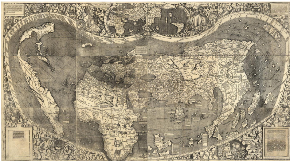
Universalis Cosmographia secundum Ptholomaei traditionem et Americi Vespucii aliorumque lustrationes, Martin Waldseemüller, 1507.