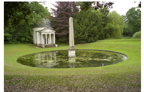
Ikonomischer Tempel und Obelisk-Teich in Chiswick House.