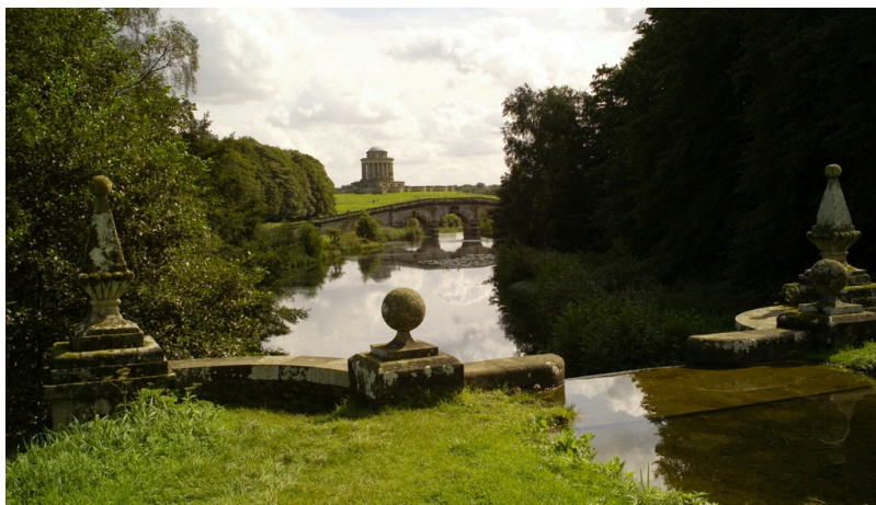
Pittoreske Landschaftsgestaltung mit Teich, Brücke und Mausoleum von Nicolas Hawksmoor, Castle Howard, 1740.