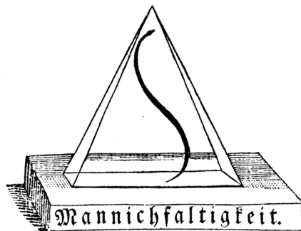
The line of beauty. William Hogarth, 1753. In: Buttler 1989