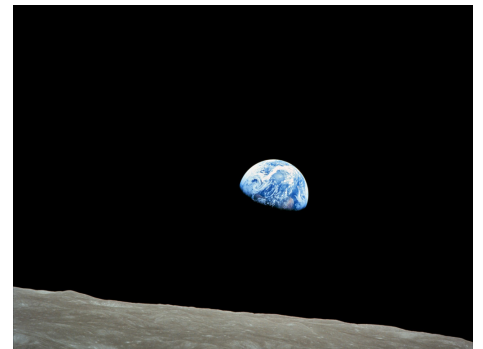
„Earthrise“, 24.12.1968, Fotografie aufgenommen von dem Astronauten William Anders während der NASA-Mission Apollo 8.