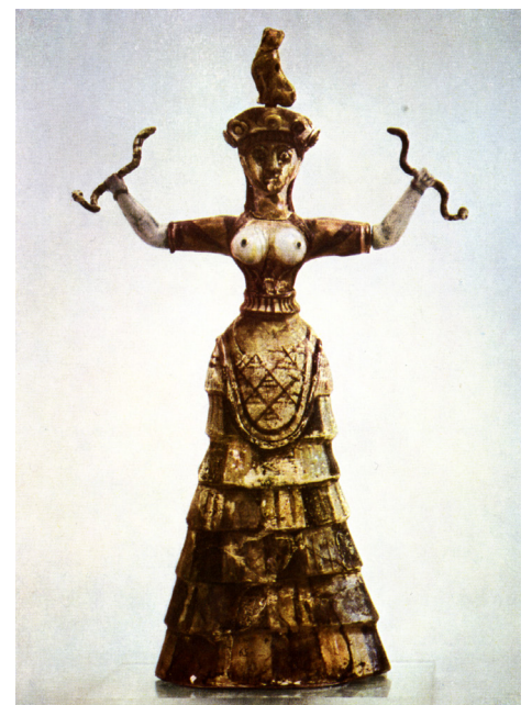
Priesterin. In: Matz 1962