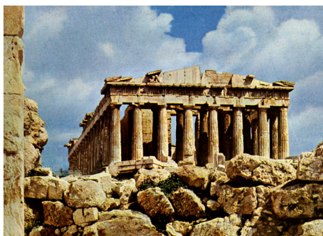
Parthenon, Akropolis von Athen. In: Matz 1962