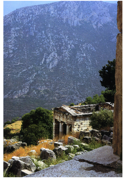
Sicht vom Apollontempel, Delphi. In: Miles, Christopher: Love in the Ancient World, London 1997