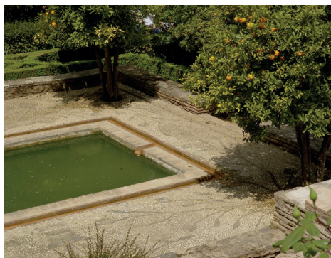
Patio der Apfelsinen in der Alhambra in Granada.