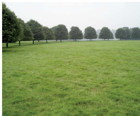
Ring aus Lindenbäumen im Woodstock Park beim Blenheim Palace.