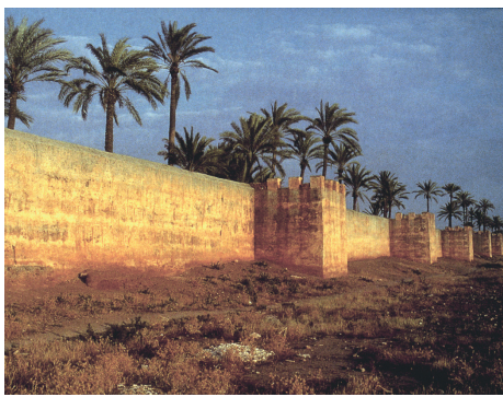
Grosse Gartenmauer in Taroudant, Marokko.