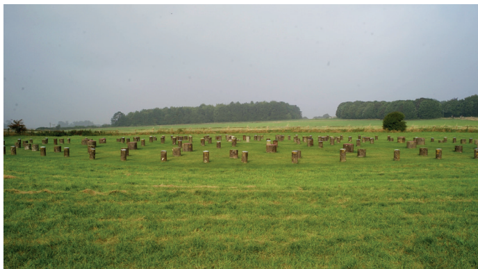
Ring aus Pfosten in Woodhenge, in der Nähe von Stonehenge.