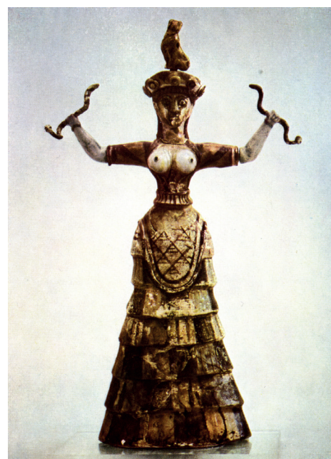
Priesterin. In: Matz 1962