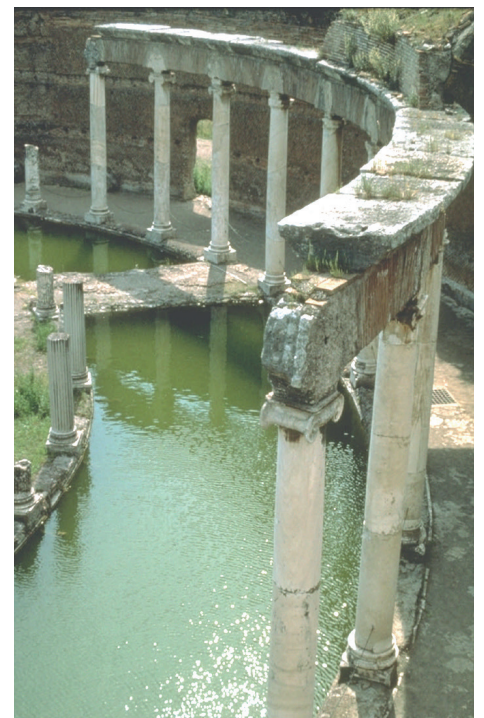
Villa Hadriana/Tivoli, ca. 125 v. Chr. Innere Kolonnade des Theaters.