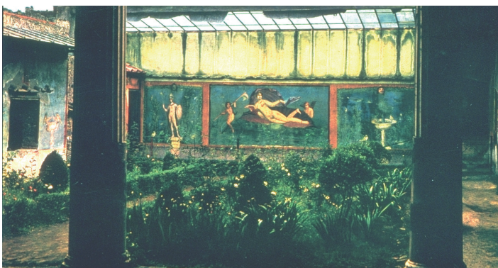
Pompeji. Haus von Venere Marina. Wandmalerei im Peristylgarten.