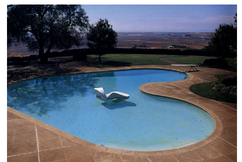
El Novillero in California, 1948. Thomas Church. In: Treib, 2003