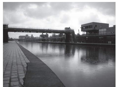
Parc de la Villette, Paris.